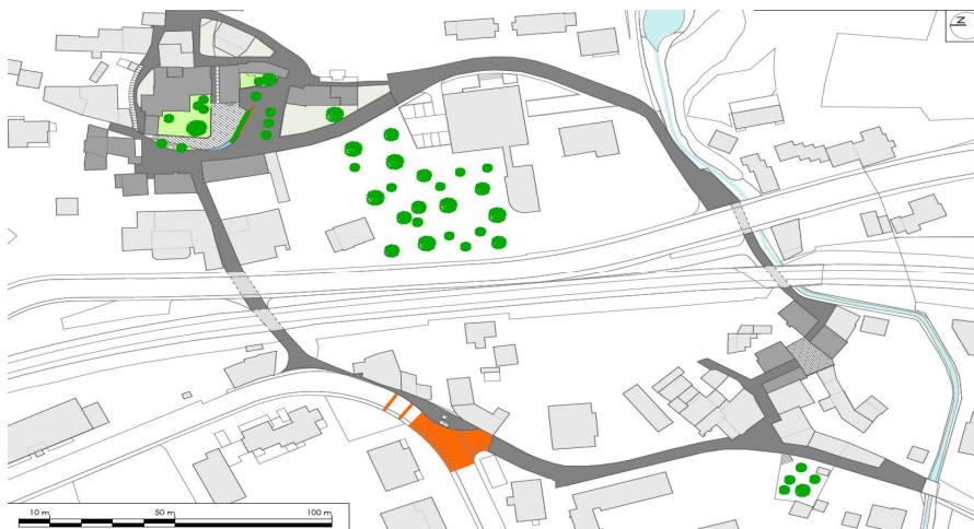
Fig. 4 – Limiti intervento nuclei

I due nuclei risultano essere collegati da un'unica pavimentazione pregiata in ghiaia stabilizzata, e comunicanti da un unico linguaggio formale nei vari punti di interesse.