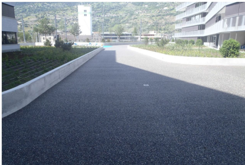
Fig. 2 – Esempio fondo in ghiaia stabilizzata

La stratigrafia del “pacchetto” stradale prevede un doppio strato di miscela PAS su cui si andrà a posare lo strato d’usura scelto. La lavorazione a due strati consente maggior sicurezza e lavorabilità per ovviare a eventuali cedimenti del sottofondo.