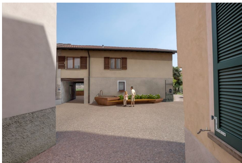
Fig. 5 – Piazza con elementi in Cor-Ten

L'arredo urbano inserito ha come legante materico l'acciaio Cor-Ten con il quale sono stati progettati tutti gli elementi proposti ovvero aiuole, fioriere, delimitazioni tra aree pubbliche e private, fontana e contenimenti di terrapieni.