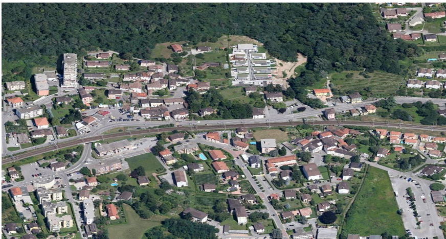
Fig. 3 – Immagine aerea del comparto

Il progetto definitivo riprende i concetti presentati nel precedente progetto di massima dell'ottobre 2015, migliorandolo sotto l'aspetto formale-funzionale e integrandolo con nuovi elementi che valorizzano i vari angoli del nucleo di sotto.